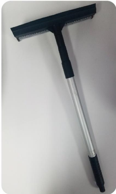
Escurreidor de Vidrios