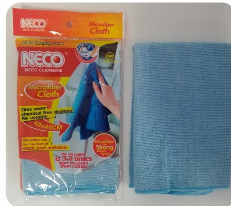
Toallitas de Microfibras