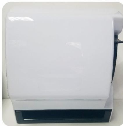
Dispensador de Papel Toalla