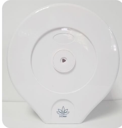
Dispensador de Papel Higienico