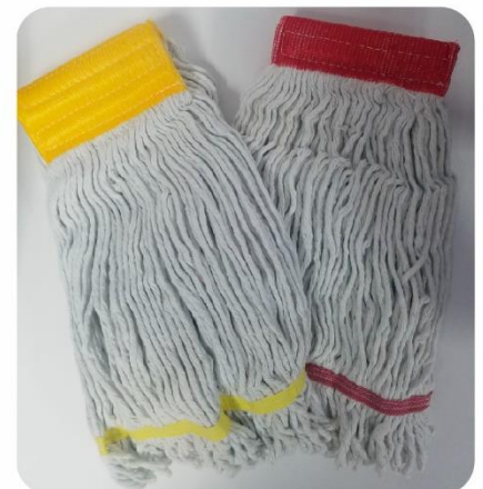
Moñas de Trapeador