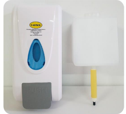
Dispensador de Jabón y Gel Antibacterial