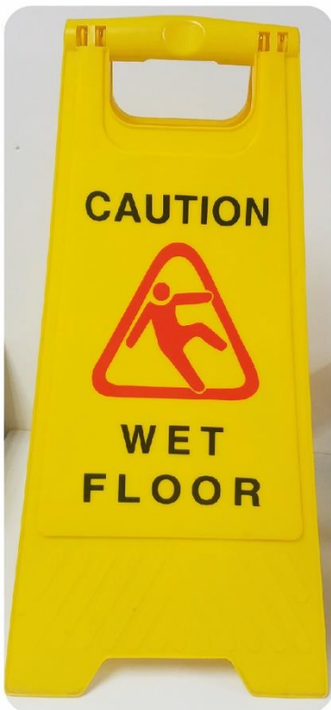
Letrero de Precaución